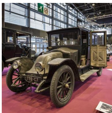
Louis Renault, carrosserie Kellner et ses Fils