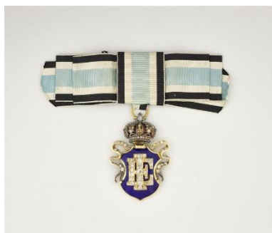
Insigne de Dame du Palais porté par la baronne de Sancy de Parabère

Autorisation de reproduction uniquement dans le cadre de la promotion de cette exposition. Toutes les images numériques fournies devront être détruites après leur utilisation.