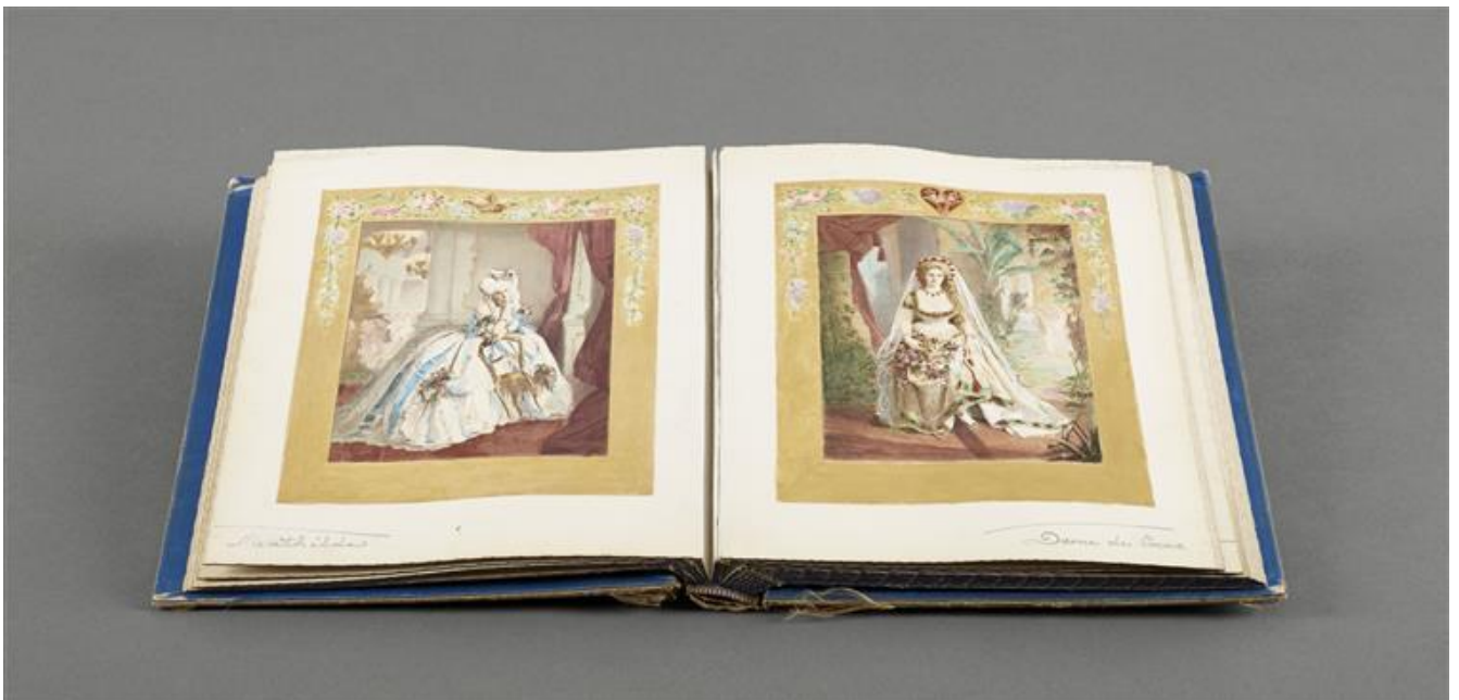
Pierre-Louis Pierson, Album de photographies de la comtesse de Castiglione , annoté par Robert de Montesquiou, © RMN-GP (domaine de Compiègne) / T. Querrec