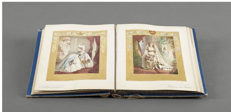
Pierre-Louis Pierson, Album de photographies de la comtesse de Castiglione , annoté par Robert de Montesquiou

Au cours des cinq dernières années, les collections du Château de Compiègne se sont enrichies de façon spectaculaire. Sans recherche d'exhaustivité, cette exposition propose d'en admirer les pièces les plus insignes. La variété des thèmes, des périodes et des techniques montrés est le reflet du caractère protéiforme du patrimoine que le château conserve.