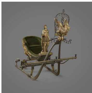
Traîneau dit de Joséphine