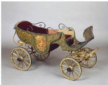
Calèche dite du duc de Bordeaux

Du 14 mai au 19 septembre en galerie de Bal